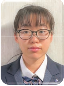
札幌国際情報高校

国際情報高校に入ってから新しい発見や驚きの連続で毎日が充実しています。私の周りには勉強や部活など様々な方面で活躍している人がたくさんいます。私も負けないように新しいことに挑戦して頑張っていきたいと思っています。